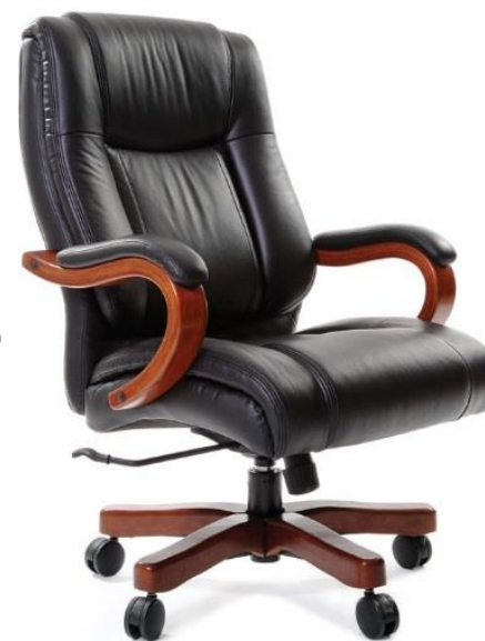
< CHAIRMAN 403 >