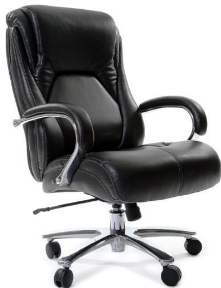
< CHAIRMAN 402 >