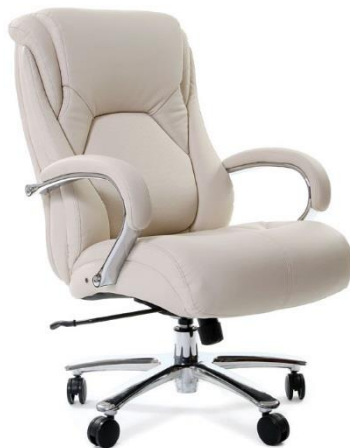
< CHAIRMAN 402 >