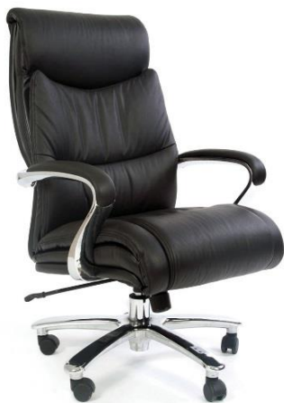
< CHAIRMAN 401 >